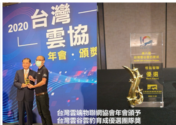
台灣雲端物聯網協會年會頒予 台灣雲谷雲豹育成優選團隊獎