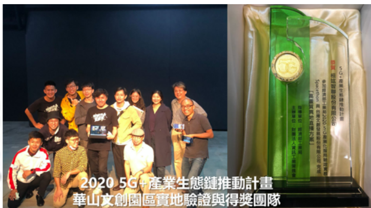
2020 5G+產業生態鏈推動計畫 華山文創園區實地驗證與得獎團隊