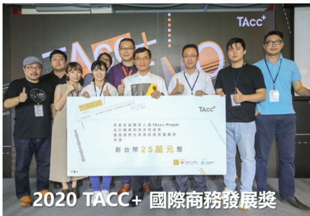
2020 TACC+ 國際商務發展獎