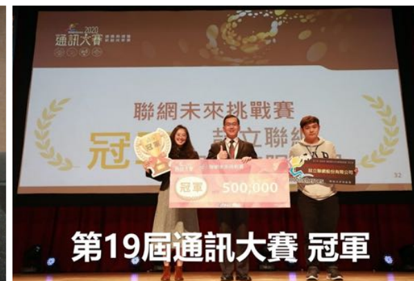
第19屆通訊大賽 冠軍