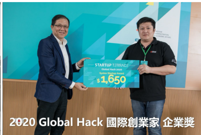
2020 Global Hack 國際創業家 企業獎